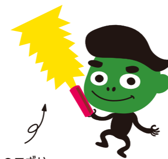
のこぎり 木材を切るための道具