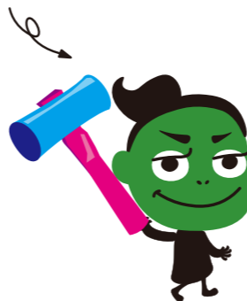
げんのろ 平らな面でのみヤクギを打つ道具