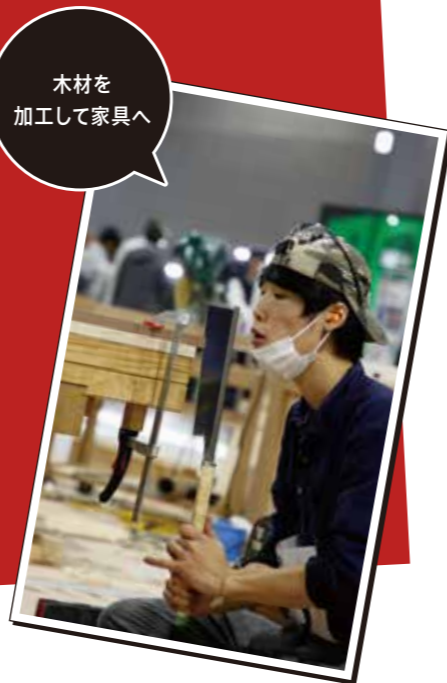
木材を加工して家具へ

どのような手順で工作していくのが重要な家具職種。使用する主な機械や電動工具は他選手と共同のため、使うタイミングには注意が必要です。また、家具づくりで特に高い技能が求められる「引出し」部分。けびきという工具で線を引き、その線に従い部品同士を組み合わせ、のこギリやノミを用いて部品同士を組み合わせる加工を施します。家具づくりにはなくてはならない作業のひとつです。