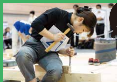
木造 建築物の 一部を再現

建築大工は、木造建築物の「墨付け（加工するための目印）」「木材の加工」「建方（土台や柱、小屋組を組み上げる棟上げまで）」「仕上げ材の取付け」などを行う職人のことです。木造建築物に代表される「家」は、人生で最も高額な買い物となります。その「家」が、建築大工の技術や技能によって着実に仕上がっていき、完成した時に家の持ち主である施主さんとともに喜びあうことができるのは、建築大工の大きなやりがいです。